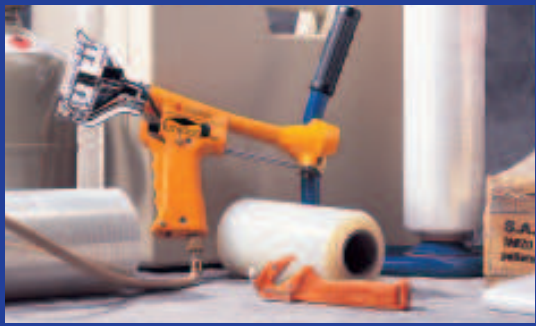
Stretchen und Folien