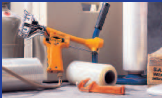
Stretchen und Folien