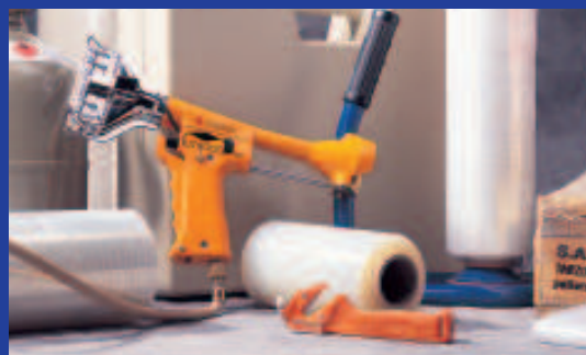
Stretchen und Folien